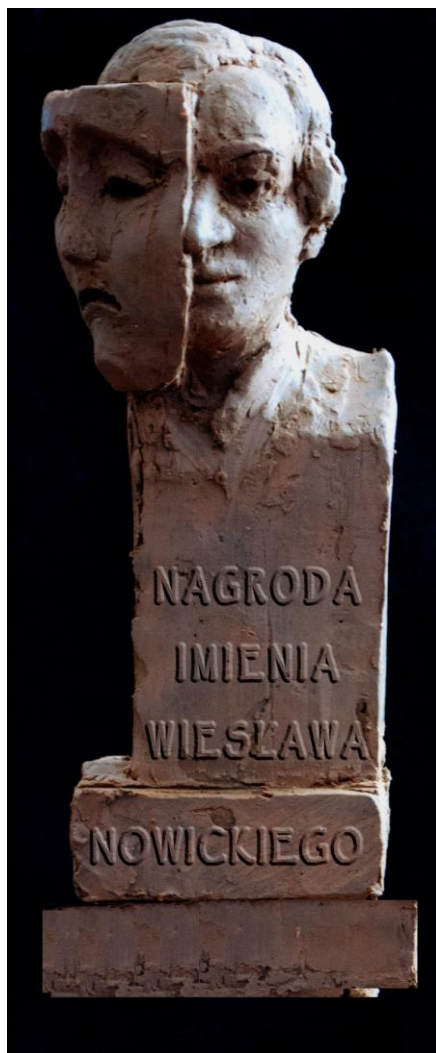
Wiesław Nowicki. Rzeźba Art. Andrzej Karolewicz