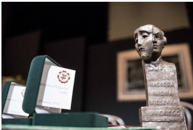
Nagroda im. Wiesława Nowickiego